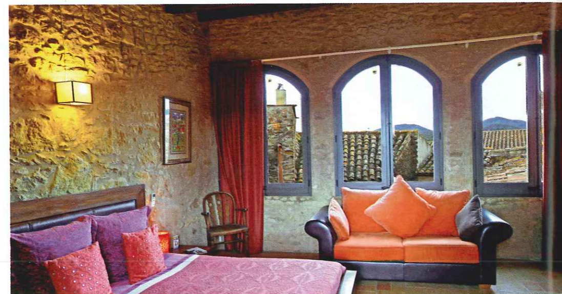
Sopra, una stanza di El Racó de Madremanya, albergo diffuso ricavato all'interno di un borgo medievale, nell'entroterra di Girona. Doppia da 125 euro.

A una manciata di chilometri dal centro storico di Lloret de Mar, questo raffinato albergo